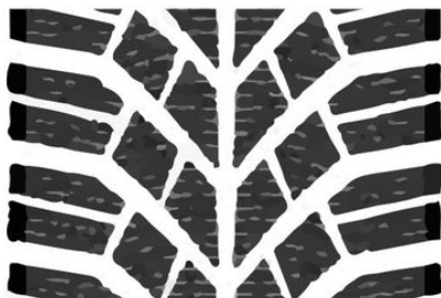
НЕШИПОВАННАЯ РЕЗИНА ЕВРОПЕЙСКОГО ТИПА

Асфальт, разбитый лед, «каша» из снега и реагентов