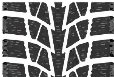
НЕШИПОВАННЫЕ ШИНЫ СКАНДИНАВСКОГО ТИПА