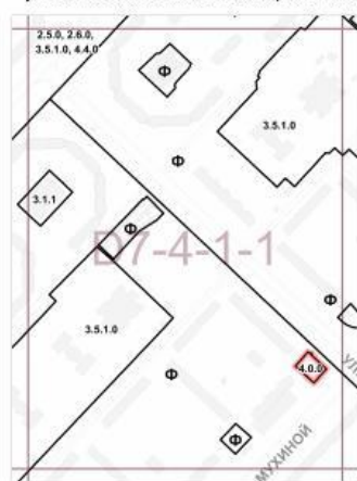
Границы территориальных зон и виды разрешенного использования земельных участков и объектов капитального строительства